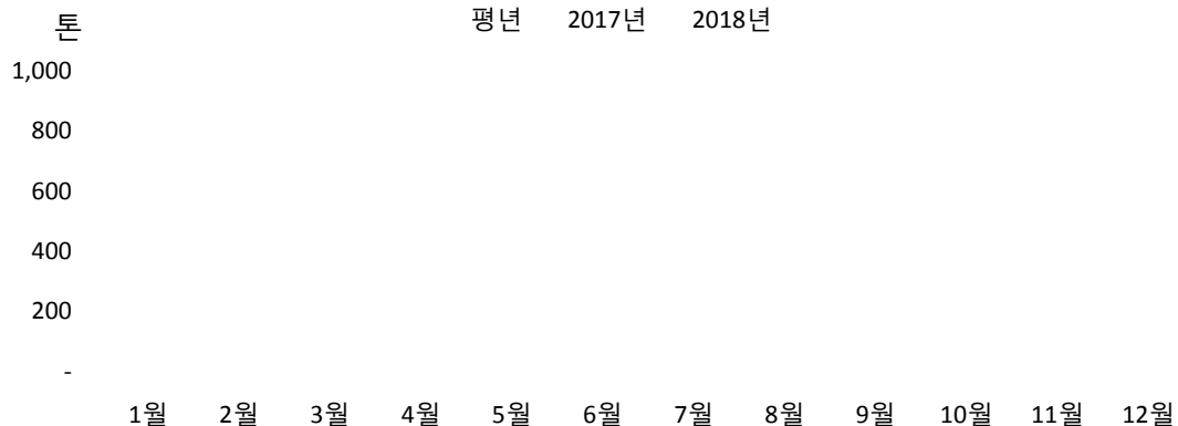
생표고 월별 수입 동향

자료: 농수산물수출지원정보(kati.net), 관세청( www.customs.go.kr )